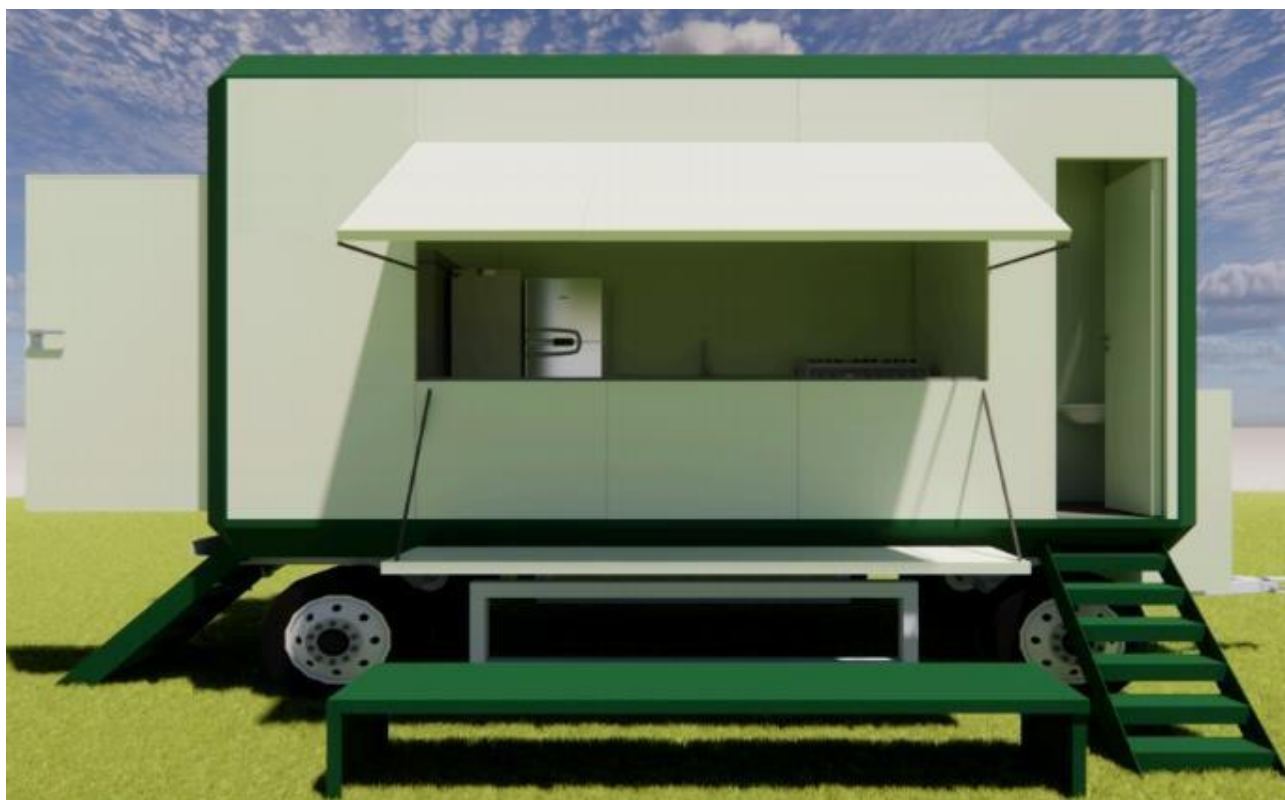
Figura 2 - Cozinha pré-fabricada sobre rodas. Vista Lateral.