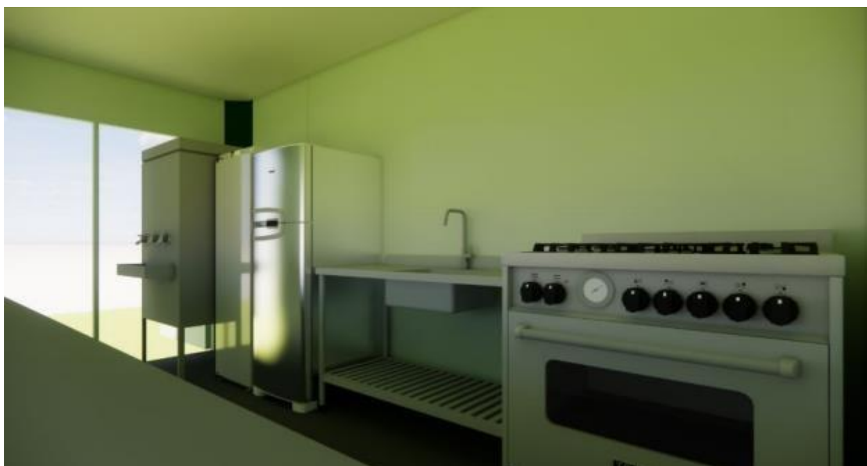
Figura 4 - Instalações internas