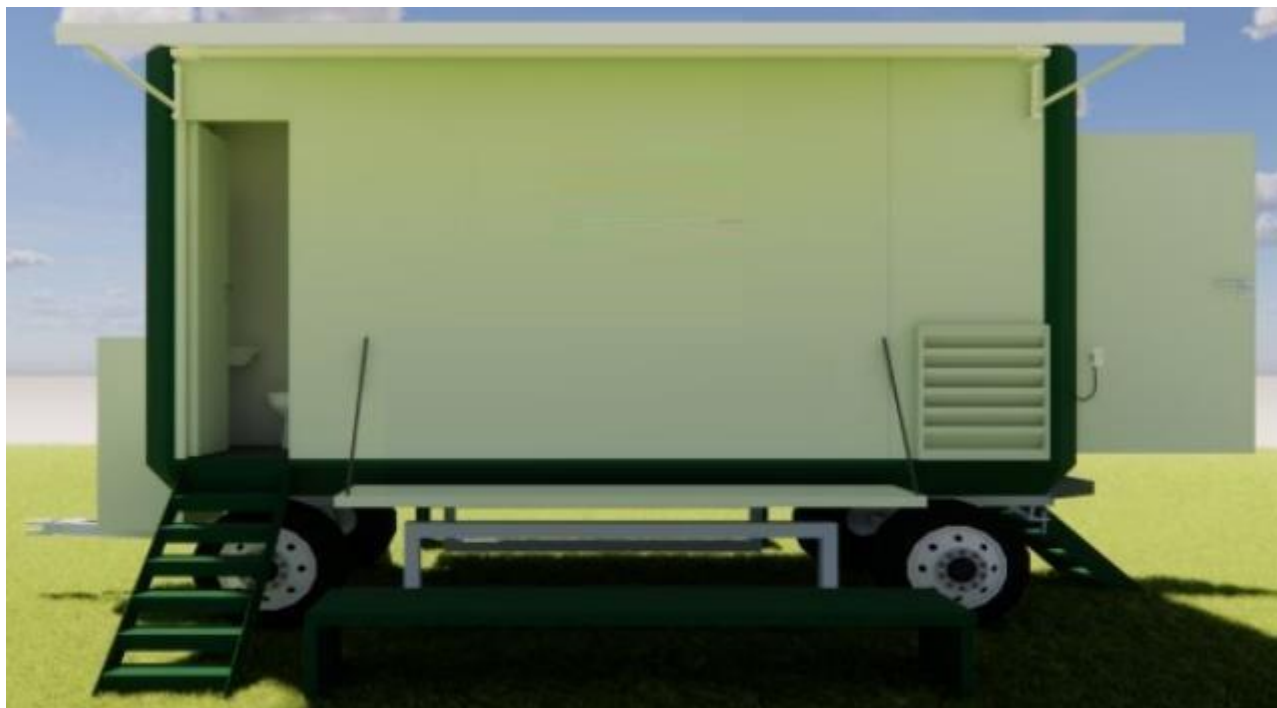
Figura 1 - Cozinha pré-fabricada sobre rodas. Vista Lateral.