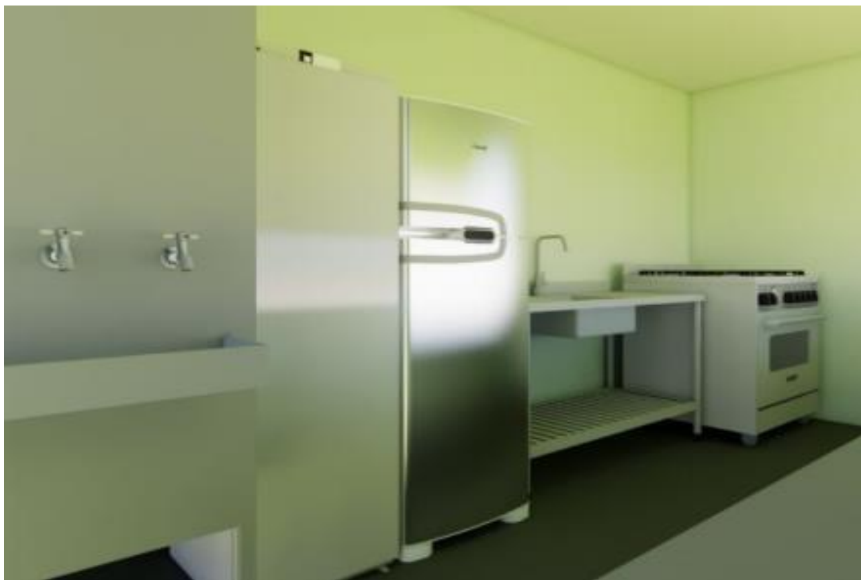
Figura 3 - Instalações internas